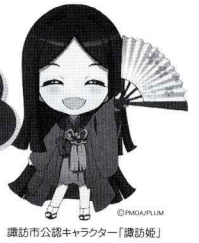
諏訪市公認キャラクター「諏訪姫」